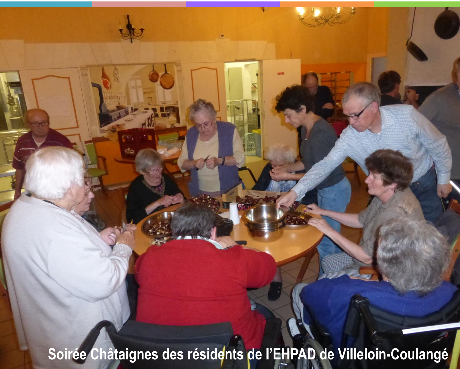
Soirée Châtaignes des résidents de l'EHPAD de Villeloin-Coulangé

Abilly ◡ La Celle-Guénand ◡ Ligueil ◡ PreUILly-sur-Claise ◡ Villeloin-Coulangé